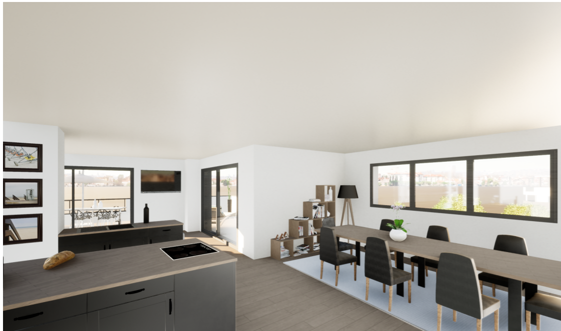
Perspective Sud -Est