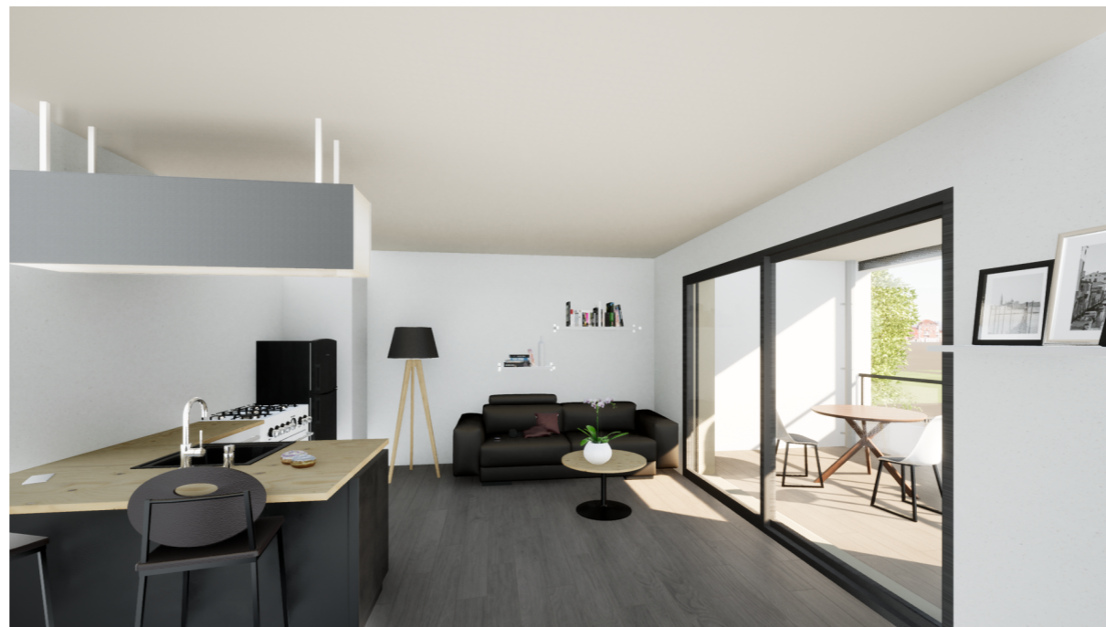
Perspective Sud -Est