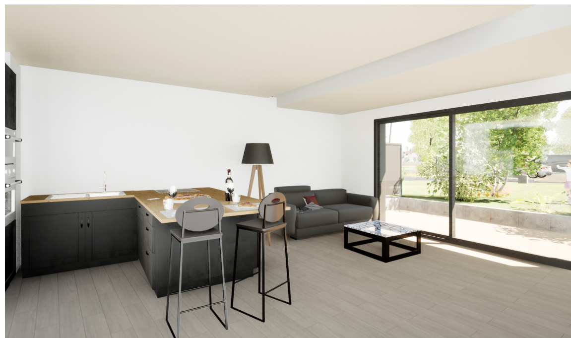
Perspective Sud -Est