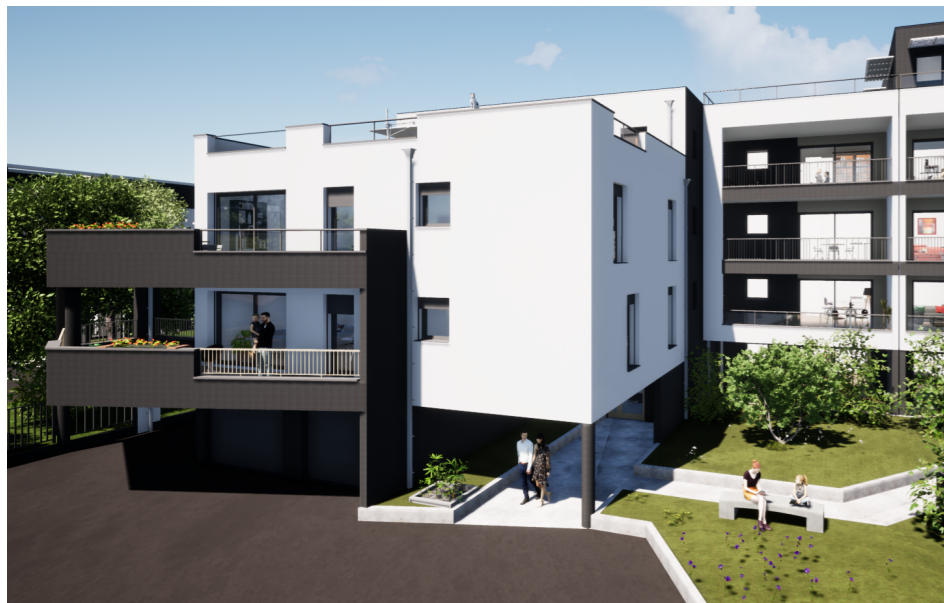
Perspective depuis le parking de la résidence