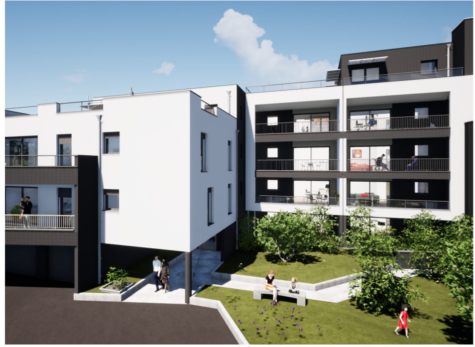
Perspective depuis le parking de la résidence