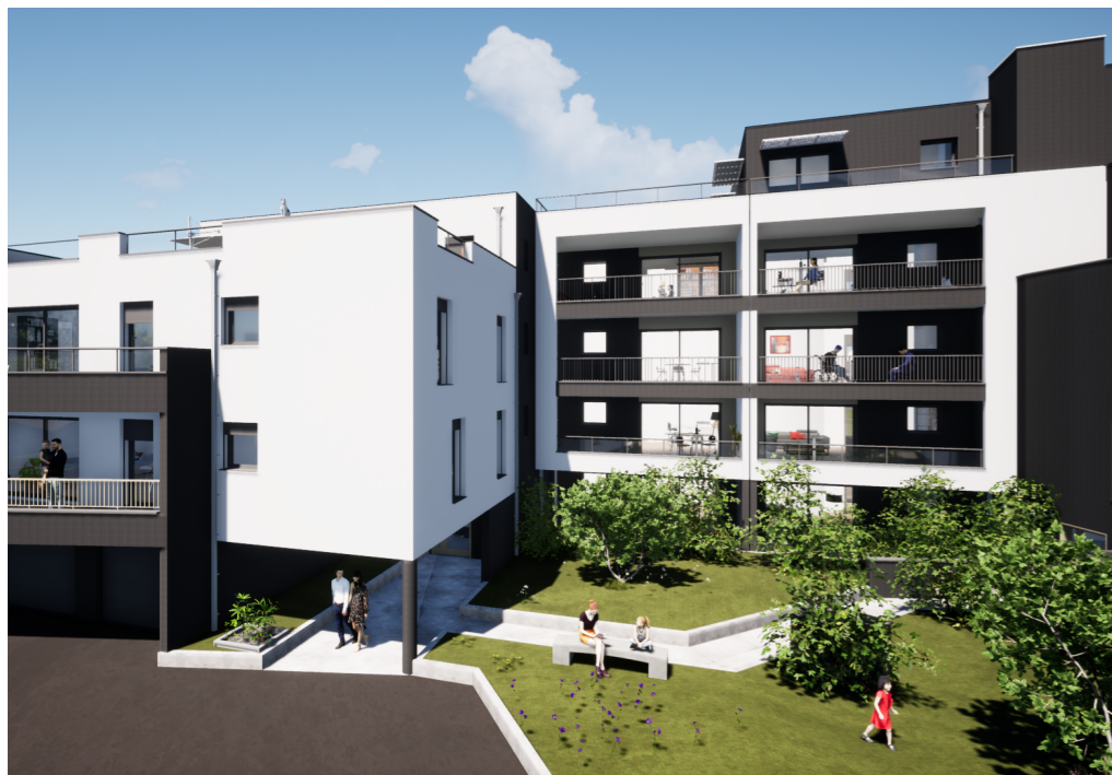
Perspective depuis le parking de la résidence