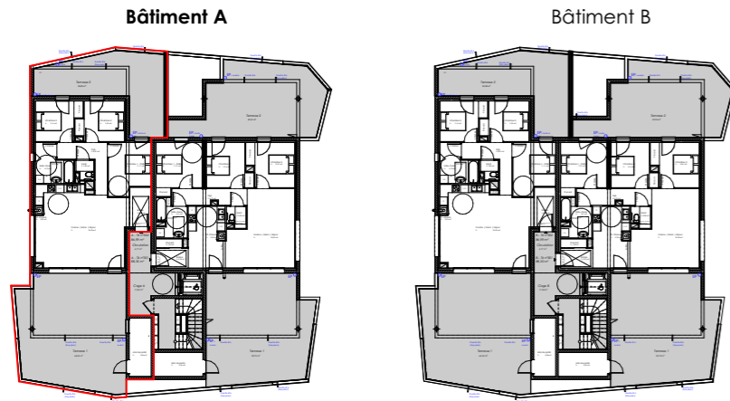
Plan d'étage courant R+3