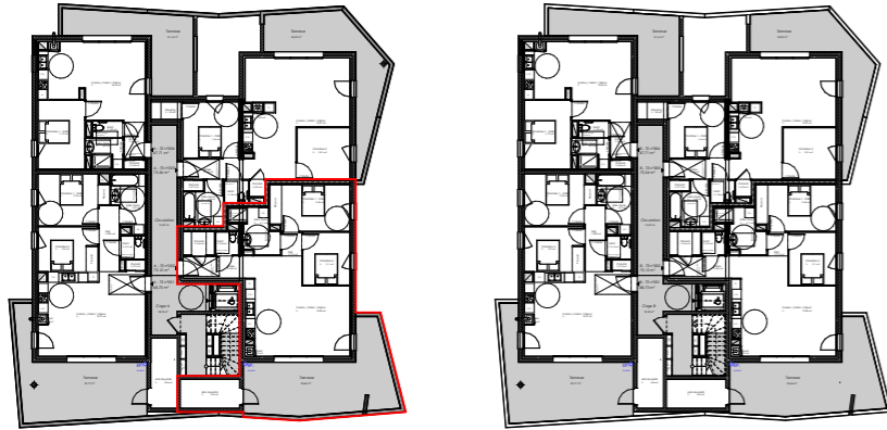
Plan d'étage courant R+2