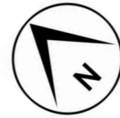
Plan d'étage courant R+1