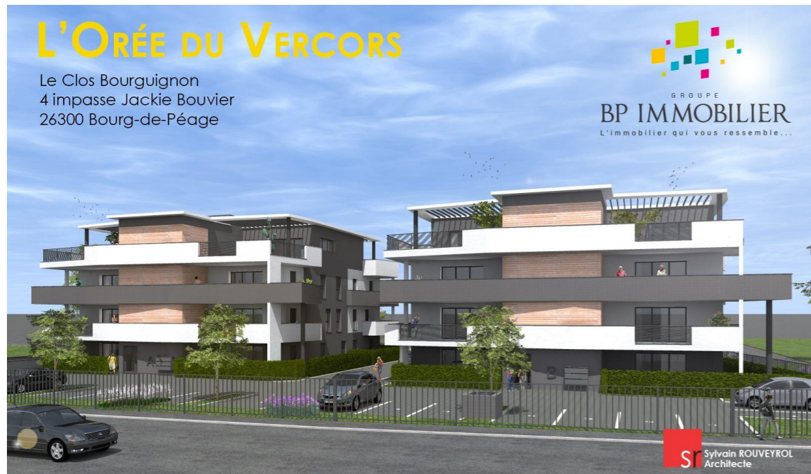
Perspective depuis l'Avenue Georges Pompidou

Nota : Le présent plan est établi sur la base du dossier de permis de construire et pourra subir des adaptations, dimensionnelles, techniques et organisationnelles, afin de répondre aux contraintes induites par les études d'exécution. Les poutres, poteaux, soffites et faux plafonds n'apparaissent pas systématiquement sur le présent plan. Les éléments de mobilier, meubles et plan de travail ne sont présentés qu'à titre indicatif et ne sont pas fournis. Plan de vente à but commercial non contractuel.