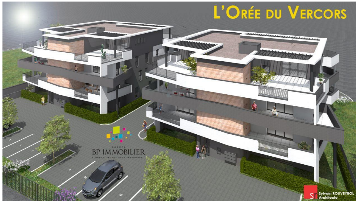
Perspective depuis l'Avenue Georges Pompidou

Nota : Le présent plan est établi sur la base du dossier de permis de construire et pourra subir des adaptations, dimensionnelles, techniques et organisationnelles, afin de répondre aux contraintes induites par les études d'exécution.