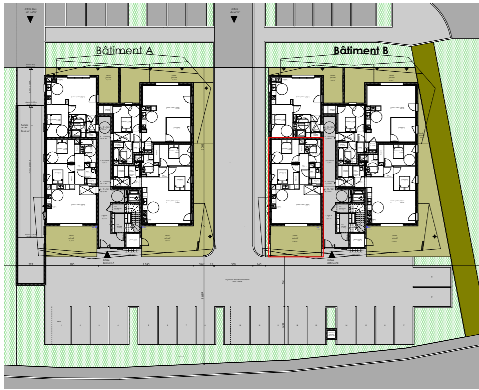
Plan d'étage courant Rdc