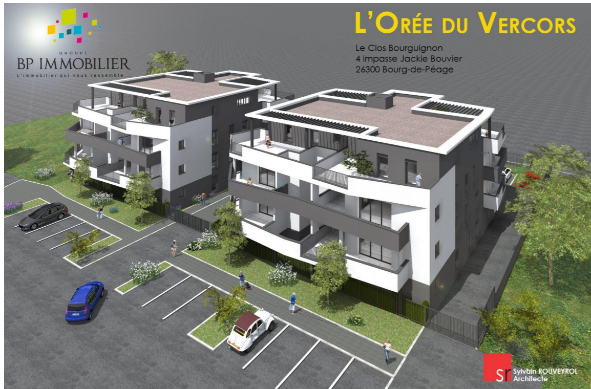
Perspective depuis l'impasse Jackie Bouvier

Nota : Le présent plan est établi sur la base du dossier de permis de construire et pourra subir des adaptations, dimensionnelles, techniques et organisationnelles, afin de répondre aux contraintes induites par les études d'exécution.