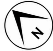
Plan d'étage courant R+3