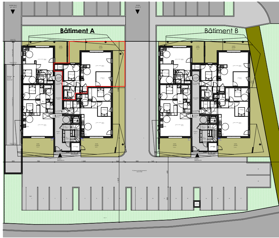
Plan d'étage courant Rdc