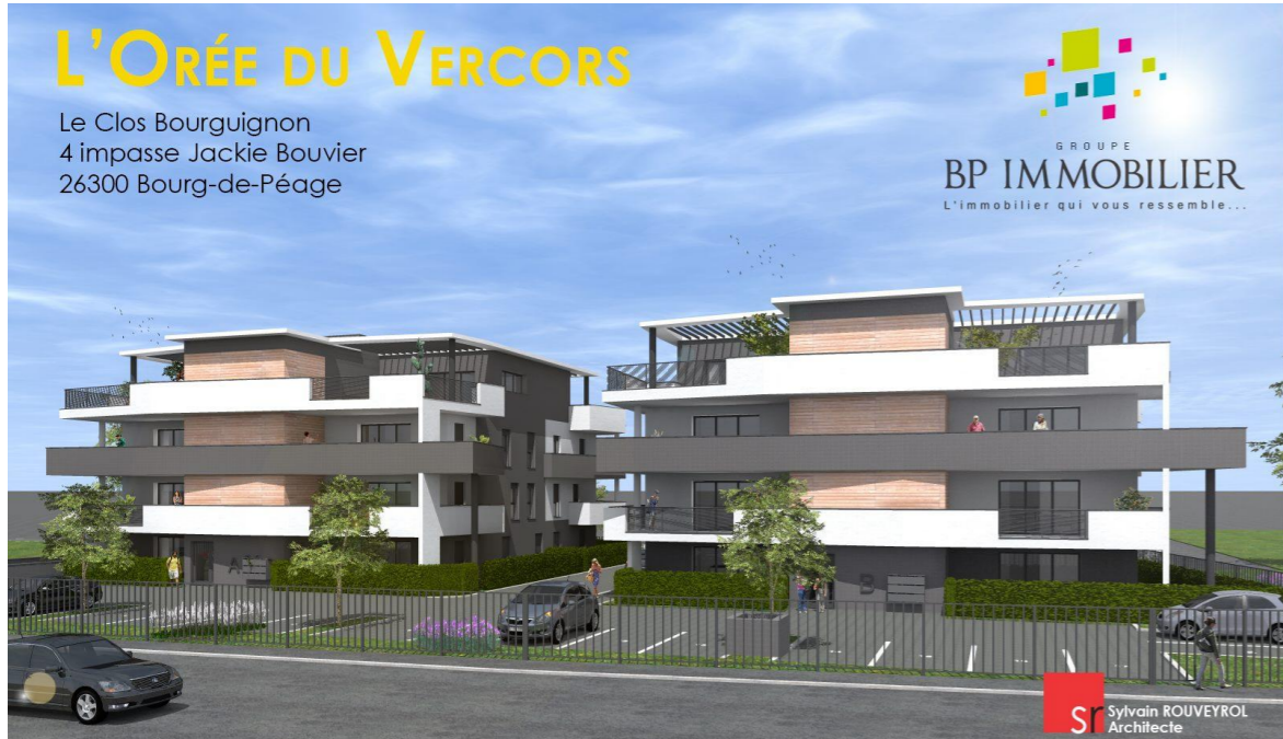
Perspective depuis l'Avenue Georges Pompidou

Nota : Le présent plan est établi sur la base du dossier de permis de construire et pourra subir des adaptations, dimensionnelles, techniques et organisationnelles, afin de répondre aux contraintes induites par les études d'exécution. Les poutres, poteaux, soffites et faux plafonds n'apparaissent pas systématiquement sur le présent plan. Les éléments de mobilier, meubles et plan de travail ne sont présentés qu'à titre indicatif et ne sont pas fournis. Plan de vente à but commercial non contractuel.