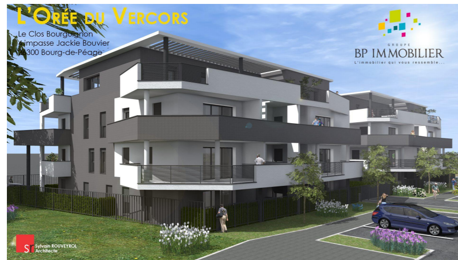
Perspective depuis l'impasse Jackie Bouvier

Nota : Le présent plan est établi sur la base du dossier de permis de construire et pourra subir des adaptations, dimensionnelles, techniques et organisationnelles, afin de répondre aux contraintes induites par les études d'exécution. Les poutres, poteaux, soffites et faux plafonds n'apparaissent pas systématiquement sur le présent plan. Les éléments de mobilier, meubles et plan de travail ne sont présentés qu'à titre indicatif et ne sont pas fournis. Plan de vente à but commercial non contractuel.