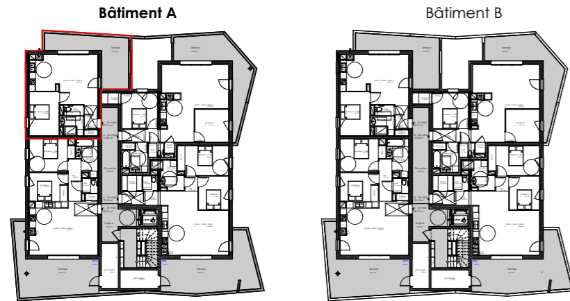
Plan d'étage courant R+2