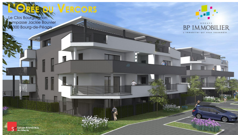
Perspective depuis l'impasse Jackie Bouvier

Maître d'oeuvre : Sylvain ROUYEYROL Architecte Sylvain ROUYEYROL, Architecte D.E.A. 9, rue Gaillard - 26100 Romans-sur-Isère Tél.: 09.70.98.03.69 - Port.: 06.30.84.71.14 E-mail: sr-architecte@outlook.fr