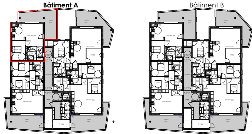
Plan d'étage courant R+1